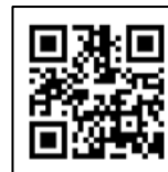
ふれあい交流室 ホームページ