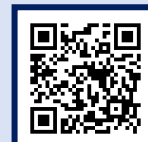
子どもの発達相談室