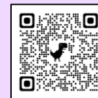
ママにおすすめエクササイズ

沼津市民限定。 応募多数の場合は抽選。 申込にはふれあい交流室の 利用者カードが必要。