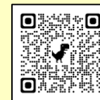
色イロリトミック

申込開始日より先着順で受付。 定員になり次第申込受付終了。 申込にはふれあい交流室の 利用者カードが必要。