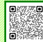
ふれあいコンサート

電話:ふれあい交流室に直接来館の 申込受付は(月)～(土)9:30～16:00 (日曜日と第3月曜日はお休み)